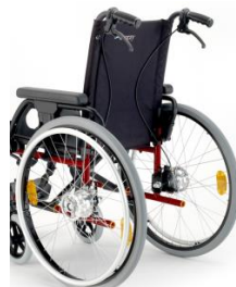
Z hamulcami bębnowymi