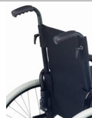
Rączki z regulacją wysokości