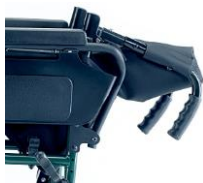
Oparcie składane do połowy