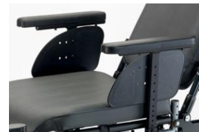
Jednosłupkowe podłokietniki z regulacją wysokości