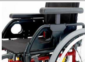
Podłokietniki z regulacją wysokości