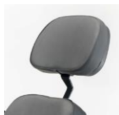
Zagłówek z materiału skóropodonego