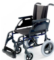
12" koło tylne