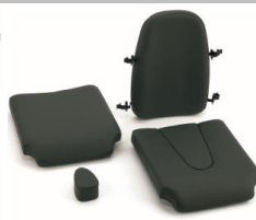
Anatomiczne siedzisko i oparcie