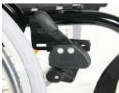
XES060002 Dźwignia blokady hamulca na wysokości kolan