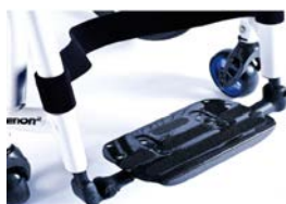
XES050132 Lekka platforma podnóżka z włókna węglowego