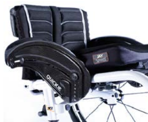
XES040104 Błotnik z włókna węglowego, z ochroną ubrań