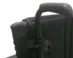
XFF 030204 Rączki do prowadzenia z regulacją wysokości