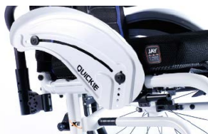
XES040103 Aluminiowa z ochroną ubrań