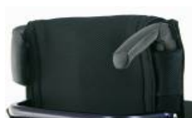
XFF 030203 Składane rączki do prowadzenia