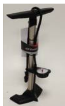
XES090024 Pompka wysokociśnieniowa