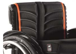
XFF 030317 tapicerka siedziska EXO PRO