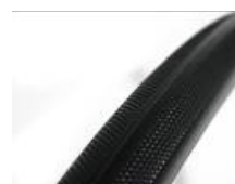
XES070102 Opona odporna na przebicia (pełna)