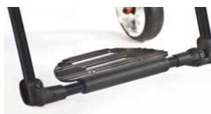
XES050059 Platforma podnóżka typu Performance