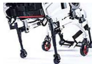
XES090010 Kółka tranzytowe