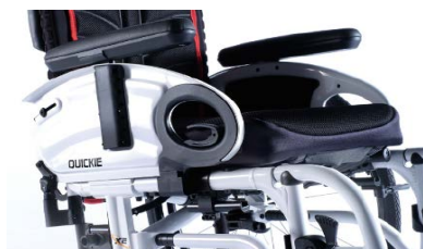
XES04000x Podłokietnik stołkowy, z poduszką, odchylany do góry, zdejmowany