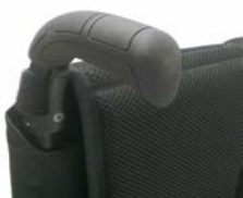
XFF 030201 Rączki do prowadzenia z długą rękojeścią