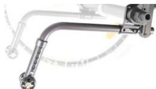
XES090050 Odlączane kółka antywywrotne