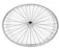
XES070002 Koło z polerowaną piastą