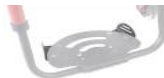
XES050127 Płytki pozycjonujące stopy