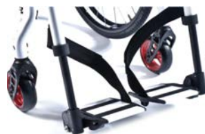
XES050022 Platforma podnóżka dzielona, odchylana, w kolorze ramy