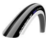
XES070101 Schwalbe Right Run