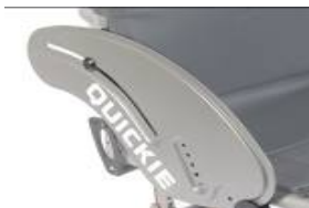
XES040102 Wąska osłona z włókna węglowego z ochroną ubrań