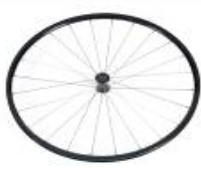
XES070003 Koło lekkie