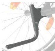
XES090001 Rurka wspomagająca przy przechylaniu