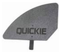
XES040107 Kompozytowa osłona boczka, odpinana