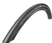
XES070107 Schwalbe One