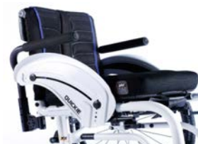
XES040117 Podłokietnik rurowy, odchylany, zdejmowany, wyściełany