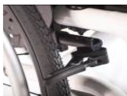
XES060003 Hamulec kompaktowy