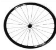
XES07000 Koło Proton