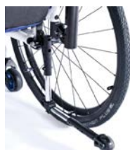
XES090004 Kółka antywywrotne odchylane