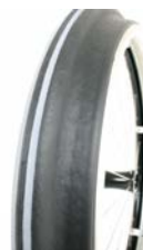
XES070208 Ciągi Maxgrepp