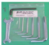
XES090000 Zestaw narzędzi