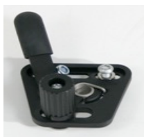
XES060001 Hamulec standardowy