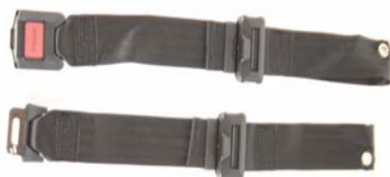
XFF 090018 Pas stabilizujący z metalową klamrą