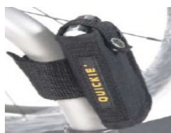
XES090026 Kieszka na telefon komórkowy