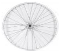
XES070001 Koło Uniwersalne