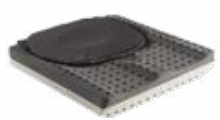
/// JAY020004 JAY Lite (na zdjęciu bez pokrowca)