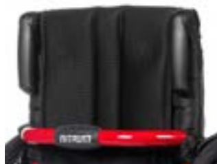
// NTR030203 Składane rączki do prowadzenia