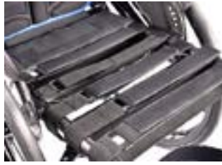
// NTR020012-020018 Tapicerka typu clip style (airflow), z reg. naprężenia