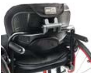
// NTR030211 Rączki do prowadzenia zdejmowalne dla oparcia Freestyle