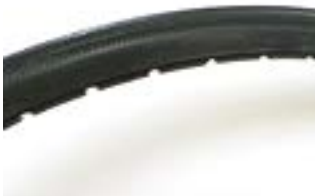
// NTR070102 Opony pełne, odporne na przebicia, z bieżnikiem