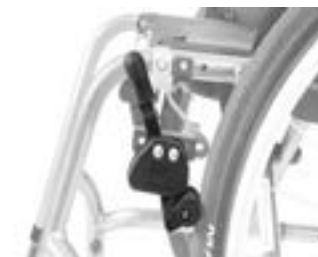
// NTR060002 Hamulce z dźwignią blokady na wysokości kolan