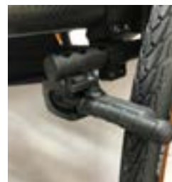
// NTR060023 Hamulce kompaktowe EVO