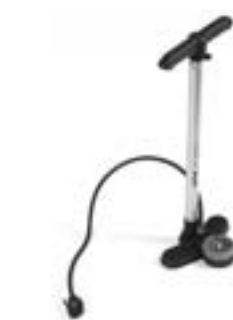
// NTR090024 Pompka wysokociśnieniowa