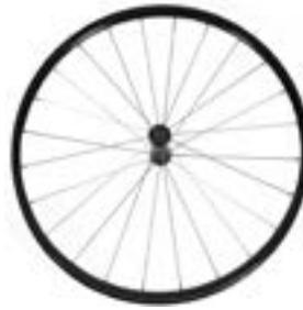
// NTR070003 Koła lekkie, 24 szprychy (srebrne), szprychy proste