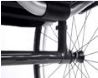
// NTR010403 Rurka osi karbonowa, superlekka