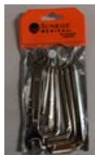
// NTR090000 Zestaw narzędzi