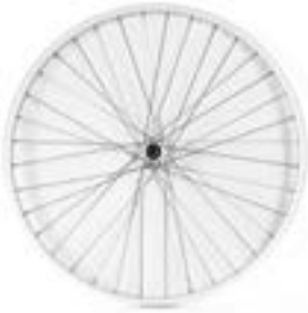
// NTR070001 Uniwersalne koła tylne, 36 szprych (srebrne), splot krzyżowy