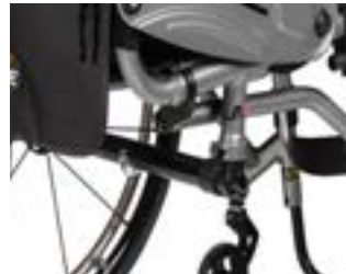
// NTR010036 Nitrum Hybrid Pro