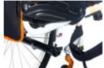
// NTR010037 Nitrum Pro