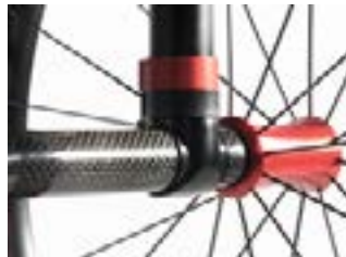
// NTR010402 Rurka osi karbonowa // NTR100553 Kolor tulei mocowań osi kół tylnych - czerwony