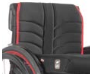
// NTR030316 Standardowa tapicerka oparcia EXO (EXO Evo)