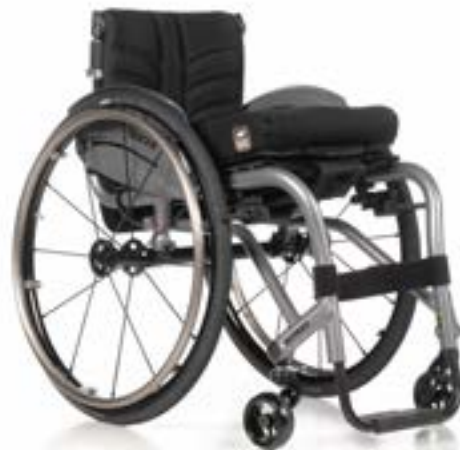
// Nitrum Hybrid Pro