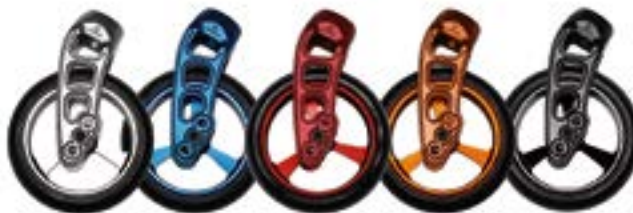
// NTR080013 & NTR080306 Widelce Carbotecture & pełne szerokie kółka z obręczą aluminiową