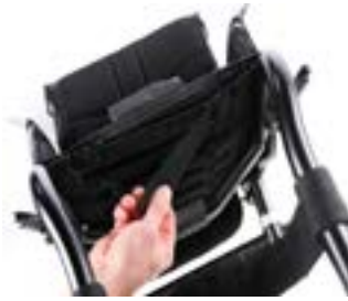
// NTR020002-020004 Tapicerka standardowa, nylonowa, z regulacją naprężenia.