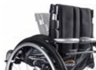
// NTR030157 Standardowe oparcie aluminiowe