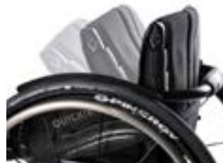
// NTR030158 Oparcie aluminiowe z mechanizmem Twist-Lock