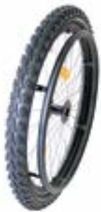
// NTR07010 Koła górskie typu Mountainbike, 36 szprych (srebrne), szprychy proste