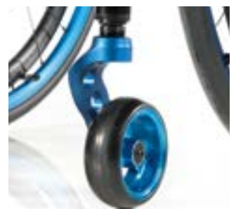
// NTR080008 Widelec jednoramienny, niebieski