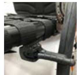
// NTR060004 Hamulce kompaktowe lekkie EVO