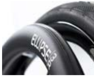
// NTR070212 Ciągi Ellipse 3R