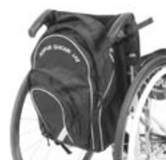
// NTR090030 Plecak