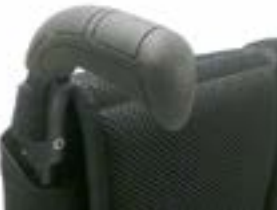
// NTR030201 Rączki do prowadzenia z długą rękojeścią