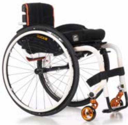
// Nitrum Pro