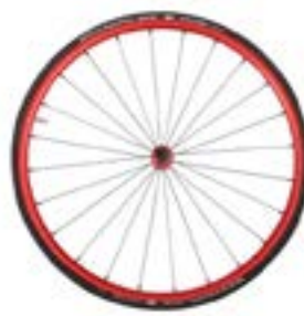
// NTR100338 Koła lekkie, anodowane, czerwone