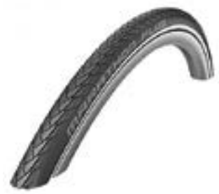
// NTR070104 Schwalbe Marathon Plus Evolution