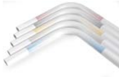
// Grafiki ramy "Floating Dots"