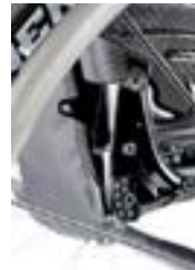
// NTR030015 Oparcie z regulacją kąta, składane