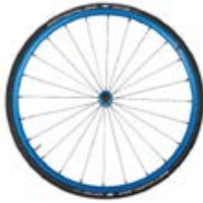
// NTR100337 Koła lekkie, anodowane, niebieskie