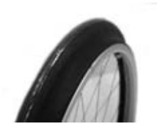
// NTR070208 Ciągi Maxgrepp®