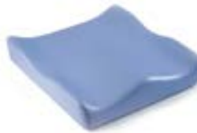
// JAY020003 JAY Soft Combi P (na zdjęciu bez pokrowca)