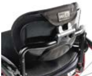
// NTR030090 Oparcie Freestyle, J3 karbonowa płyta oparcia, płytki kontur (SC)