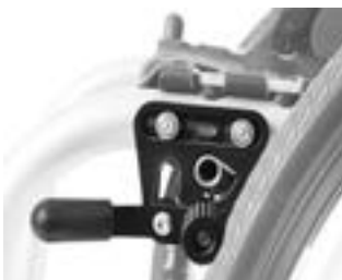
// NTR060001 Standardowe hamulce