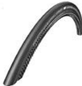
// NTR070107 Schwalbe One