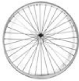
// NTR070002 Koła z polerowaną piastą, 36 szprych (srebrne), szprychy proste