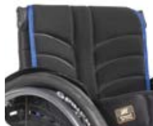
// NTR030317 Tapicerka oparcia EXO PRO (EXO Evo)