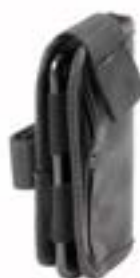
// NTR090026 Kieszeń na telefon