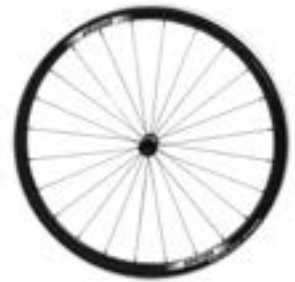
// NTR070004 Koła superlekkie Proton, 24 szprych (czarne), szprychy proste