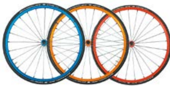
// NTR07003 Koła lekkie, 24 szprychy, szprychy proste, wersje kolorystyczne do wyboru na str. 17 (NTR100336 - NTR100338)