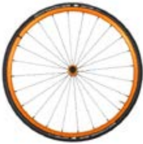
// NTR100336 Koła lekkie, anodowane, pomarańczowe