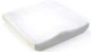
// JAY020002 JAY Basic (na zdjęciu bez pokrowca)