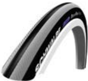
// NTR070101 Schwalbe Right Run