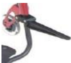
XES090019 Uchwyt Caddy na torby