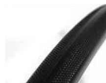
XES070102 Opona odporna na przebicia (pełna)