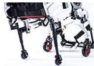
XES090010 Kółka tranzytowe