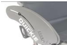
XES040102 Wąska osłona z włókna węglowego z ochroną ubrań