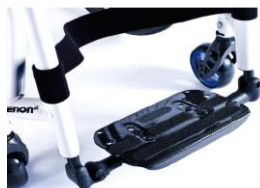
XES050132 Lekka platforma podnóżka z włókna węglowego