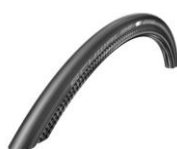
XES070107 Schwalbe One