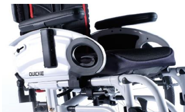
XES04000x Podłokietnik stolikowy, z poduszką, odchylany do góry, zdejmowany