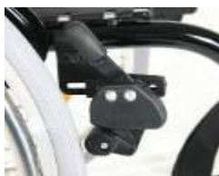
XES060002 Dźwignia blokady hamulca na wysokości kolan