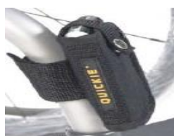
XES090026 Kieszka na telefon komórkowy