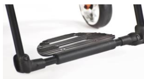
XES050059 Platforma podnóżka typu Performance