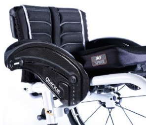
XES040104 Błotnik z włókna węglowego, z ochroną ubrań