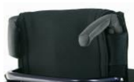
XFF 030203 Składane rączki do prowadzenia