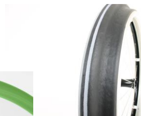
XES070208 Ciągi Maxgrepp