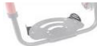
XES050127 Płytki pozycjonujące stopy