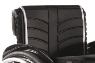
XFF 030316 tapicerka siedziska EXO