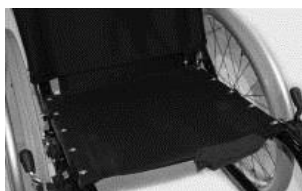
XFF 020002 tapicerka siedziska z 1 kieszenią