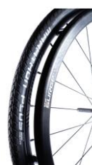
XES070211 Ciągi Surge®