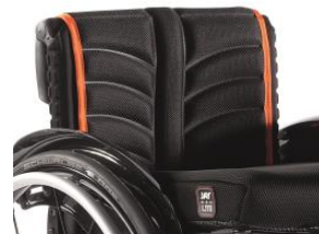
XFF 030317 tapicerka siedziska EXO PRO