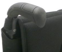
XFF 030201 Rączki do prowadzenia z długą rękojeścią