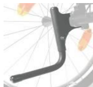
XES090001 Rurka wspomagająca przy przechylaniu