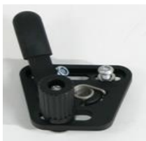
XES060001 Hamulec standardowy