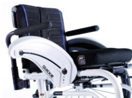
XES040117 Podłokietnik rurowy, odchylany, zdejmowany, wysięcielany