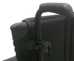
XFF 030204 Rączki do prowadzenia z regulacją wysokości