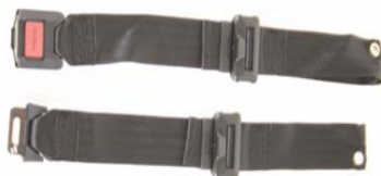
XFF 090018 Pas stabilizujący z metalową klamrą