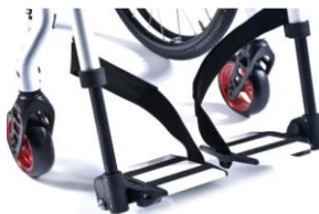
XES050022 Platforma podnóżka dzielona, odchylana, w kolorze ramy