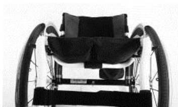
XFF 020003 tapicerka siedziska z 2 kieszeniami