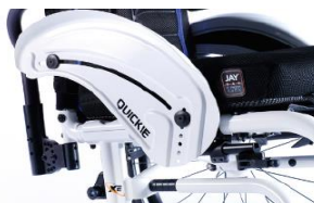
XES040103 Aluminiowa z ochroną ubrań