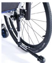
XES090004 Kółka antywywrotne odchylane