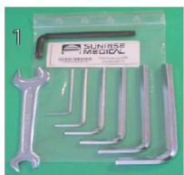
XES090000 Zestaw narzędzi