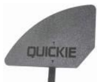
XES040107 Kompozytowa osłona boczka, odpinana